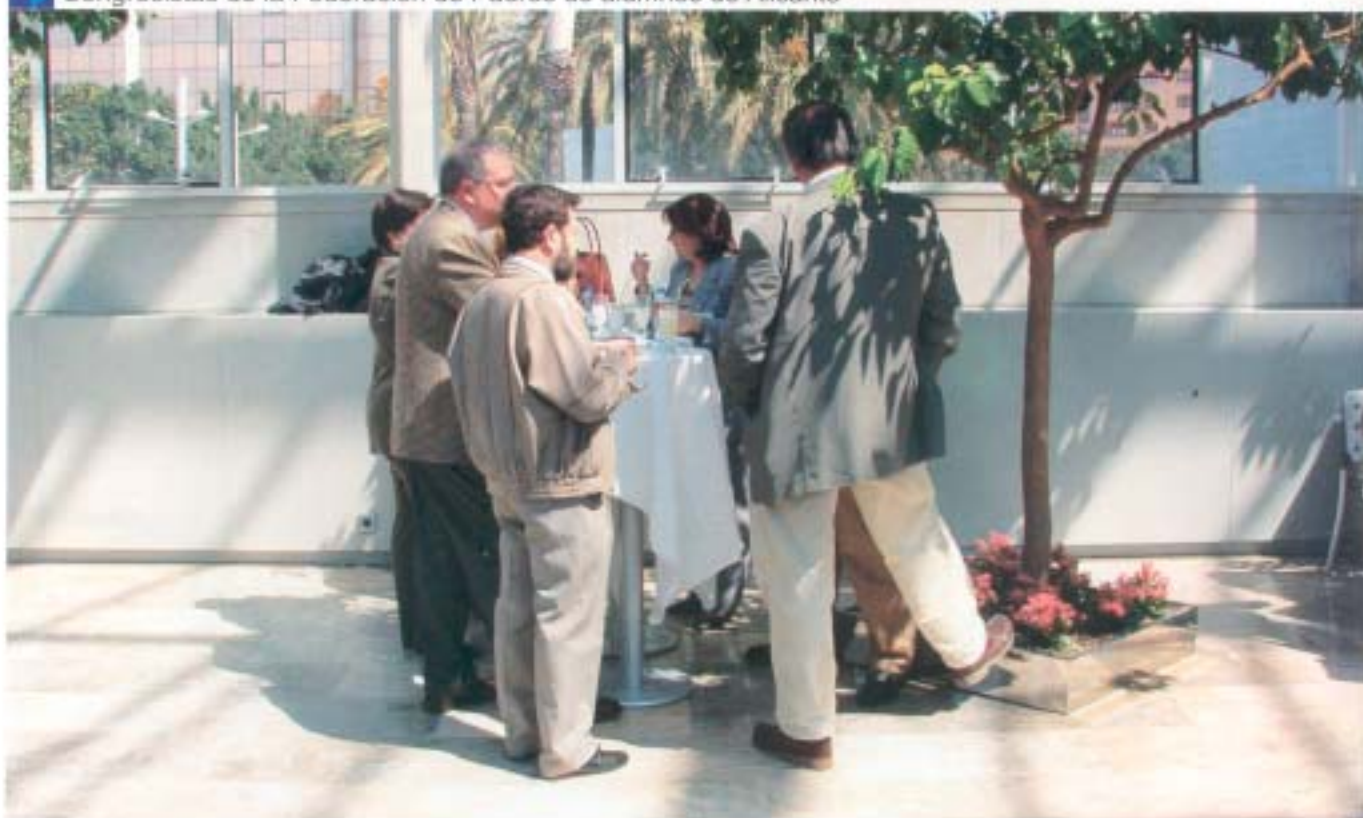
Congresistas de la Federación de Padres de alumnos de Alicante