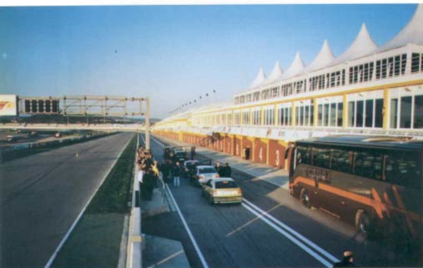
Momentos previos al inicio del recorrido por el circuito. Los coches especiales preparados en boxes, junto a la recta de tribuna.