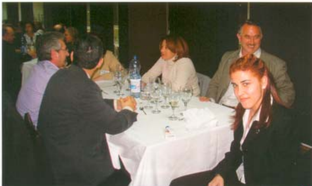
Congresistas de Alicante