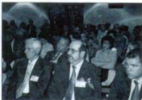
Asisten un centenar de representantes de asociaciones católicas de padres.