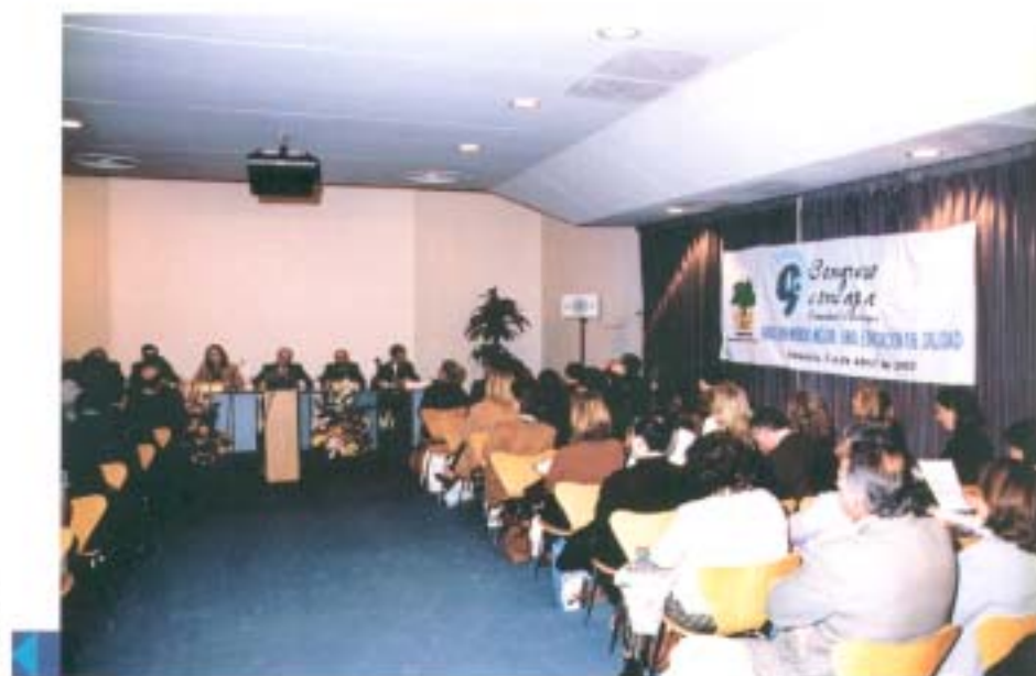
Un aspecto general de la Sala, durante el acto de apertura del Congreso