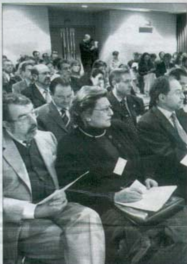
Un grupo de representantes de los padres católicos durante el congreso.

El objetivo final de la petición de los concertos educativos para bachillerato es que cuando un niño empiece en la etapa infantil en un colegio, libremente elegido por sus padres, pueda salir con el bachillerato terminado "y no tener que dejarlo, en cuarto de secundaria, por motivos económicos", señala Monter.