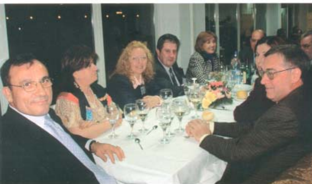
Dirigentes de la Federación de Valencia