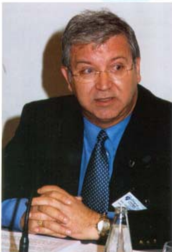
El Sr. Felipe contestando a las intervenciones de los congresistas

El último eje fundamental era el de la autonomía de los centros. Esta está relacionada con el estímulo, la responsabilidad de estos en el logro de los buenos resultados obtenidos. Es evidente que no todos los centros deben llevar a cabo las mismas acciones. Los alumnos son diferentes, las situaciones son diferentes y, por tanto, la normativa debe permitir que cada centro en función de su problemática, tenga la autonomía de gestión de programación educativa efectiva."