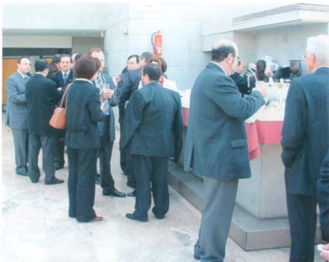
Un grupo de asistentes y congresistas, durante la pausa-café, entre ponencias.