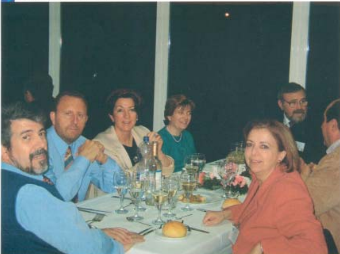
Congresistas de Valencia