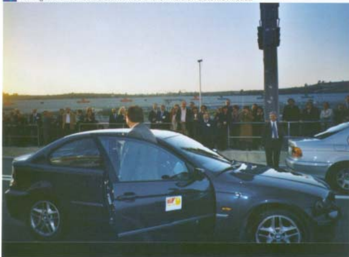
Vista general de los asistentes a la exhibición automovilística