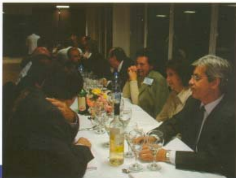
Mesa de Autoridades y dirigentes de CONCAPA