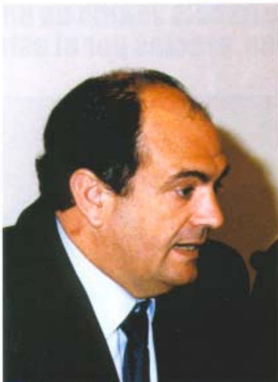
El Concejalejo de Educación del Ayuntamiento de Valencia, D. Emilio del Toro

representados, para lo cual es preciso el esfuerzo de todos, y deseando que la jornada y los actos previstos se desarrollen con el mayor éxito posible.