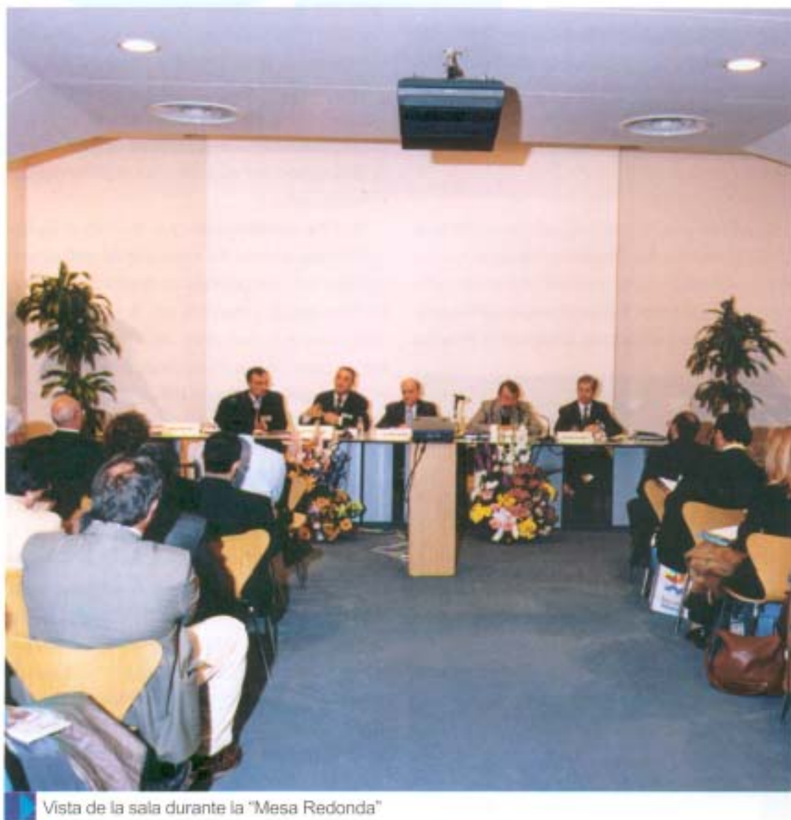
Vista de la sala durante la "Mesa Redonda"

Hizo mención del problema de la repetición de curso. Estimó preciso se produzcan actuaciones específicas en el tramo de los tres a los doce años, y destacó como el mayor problema a resolver que la L.O.C.E. sólo permite repetir curso una vez, con lo que se plantearán inmediatamente cuestiones de difícil solución.