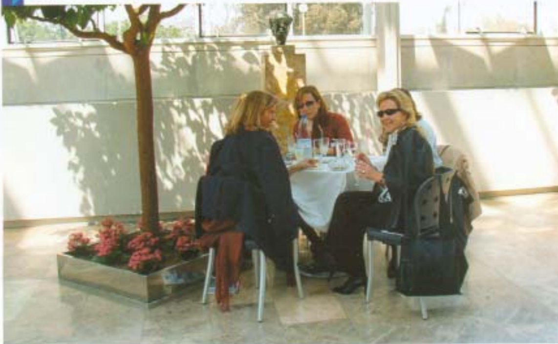
Grupo de congresistas del APA Parque-Colegio Santa Ana, de Valencia, durante la comida