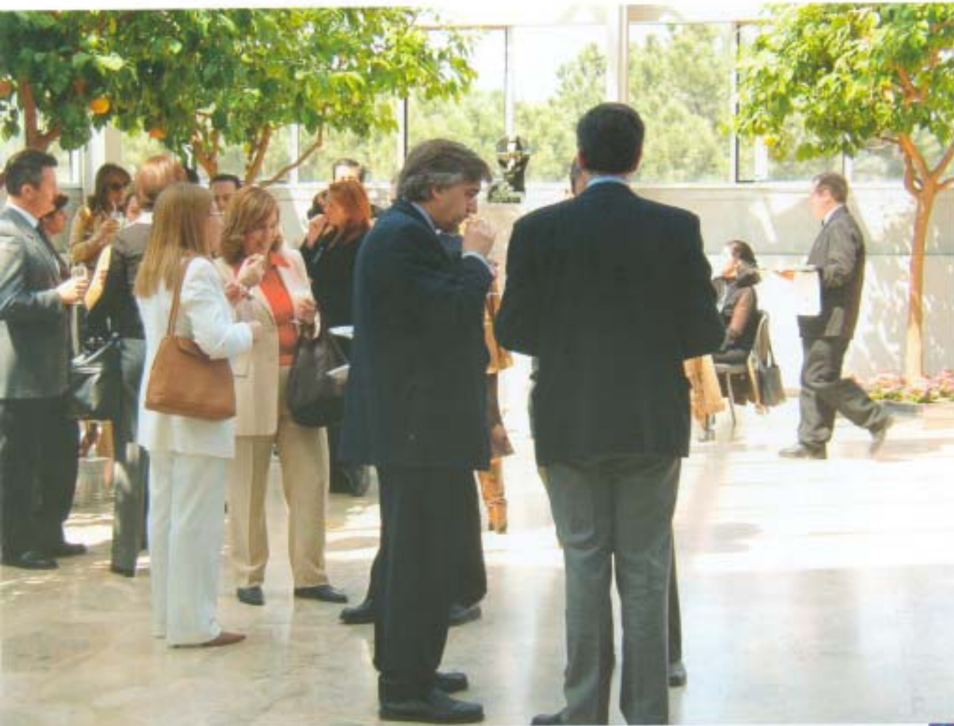
Aspecto general de la zona acristalada del Palu de la Música, durante la comida