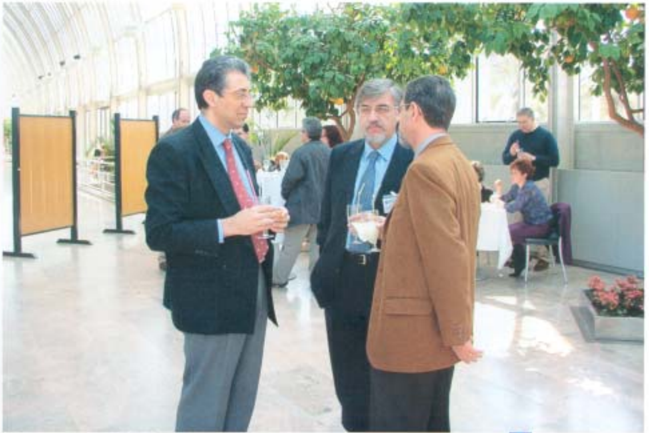
Representantes de APAS de Valencia, presentes en momentos previos a la comida