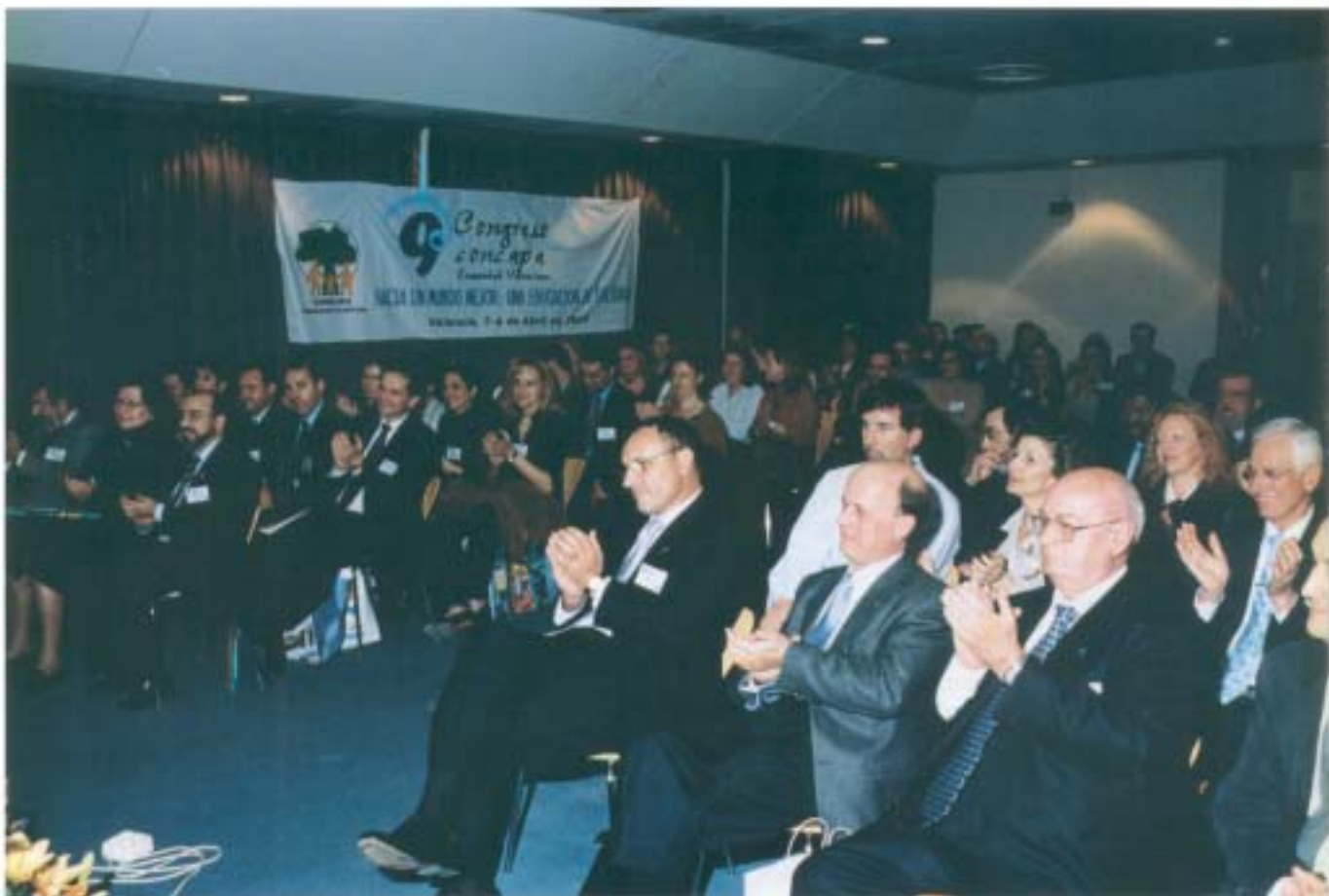
Algunos de los invitados

Un ejemplo de máxima representación femenina: Apa P. Colegio Sta. Ana, de Valencia